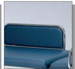
Seitengitter - gepolstert