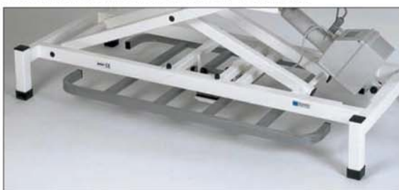
längsseitiger Fußbetätigungsrahmen, auch nachrüstbar