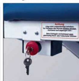
Sperrbox Nr. 1995