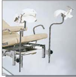
Beinhalter - Standard