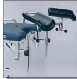
Beinhalter nach Göpel