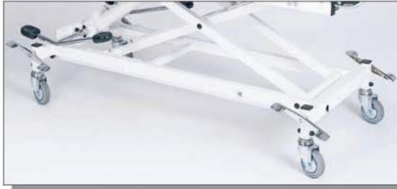
4 Rollen, zentral feststellbar (Standard)