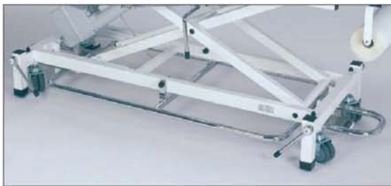
umlaufender Fußauslöserahmen, verchromt