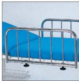
Seitengitter - steckbar