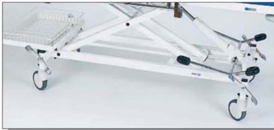
4 Rollen, zentral feststellbar (Comfort-Rollen)