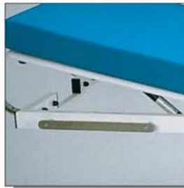
OP-Schiene für Zubehör