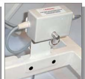
Sperrbox Nr. 1993