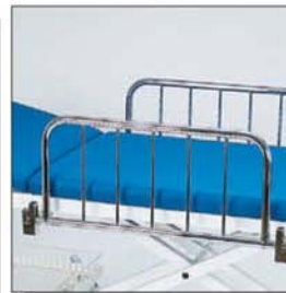
Seitengitter - klappbar