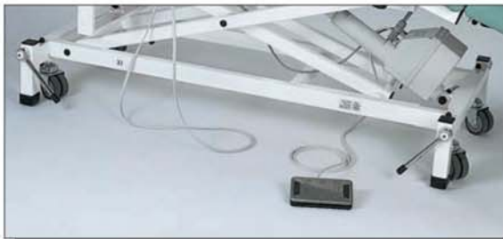
Rad-Hebe-System, in jeder Höhe fahr-/feststellbar