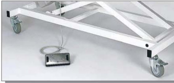
4 einzeln feststellbare Laufrollen